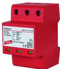
Az ábrák nem kötelező érvényűek